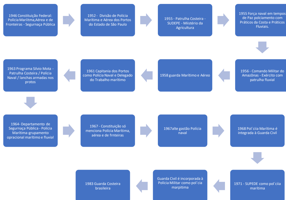
Figura 2: Imagem ilustrativa sobre os atores policiais a partir de 1945 até 1985.